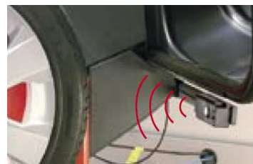
sonar pomiaru nie centryczności