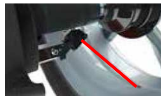
laser wskazujący i pomiarowy