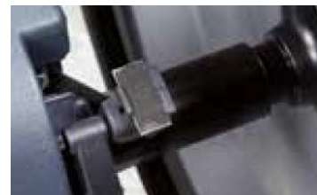
Podajnik ciężarków z automatycznym blokowaniem