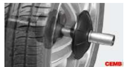
Uchwyt pneumatyczny (opcja)