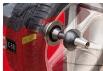
Uchwyt pneumatyczny (opcja SE)