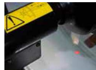
SPOTTER - laser wskazujący