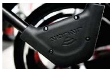
Sonar szerokości (opcja)