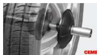
Uchwyt pneumatyczny (opcja)