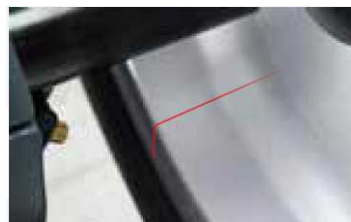
Laser liniowy wskazujący