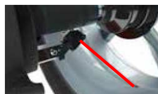
laser wskazujący i pomiarowy