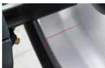
Laser liniowy wskazujący