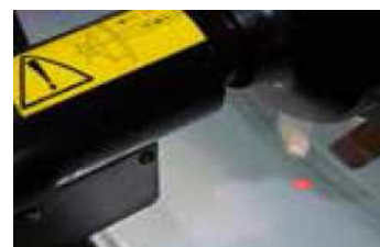
SPOTTER - laser wskazujący