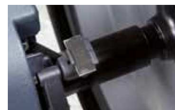
Podajnik ciężarków z automatycznym blokowaniem