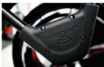
Sonar szerokości (opcja)