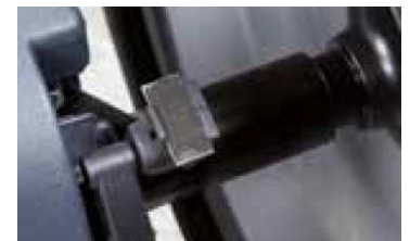
Podajnik ciężarków z automatycznym blokowaniem