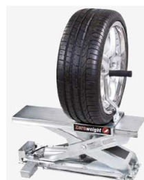
Winda koła (opcja)