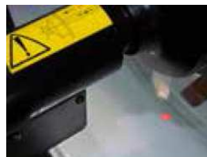
SPOTTER - laser wskazujący