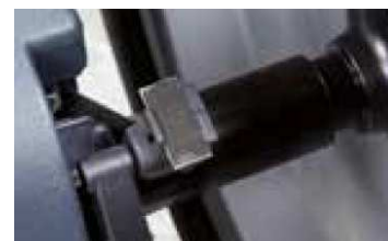
Podajnik ciężarków z automatycznym blokowaniem