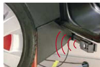
sonar pomiaru nie centryczności