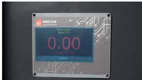
Ekran dotykowy sterówki monitoringu olejowego