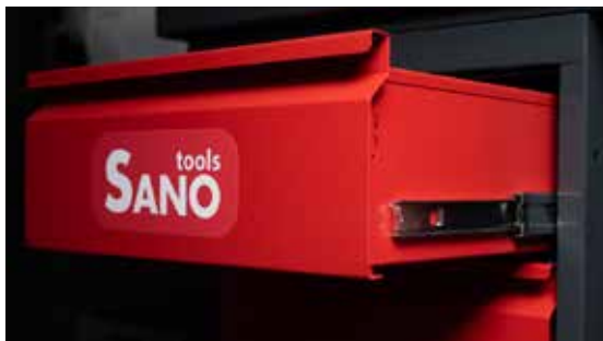
Solidne prowadnice szuflad narzędziowych