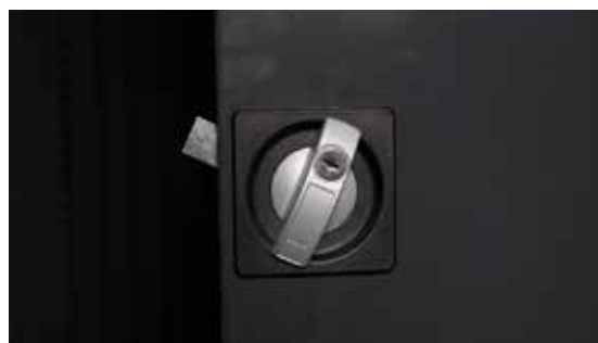
Zamek blokujący drzwi szafy na narzędzia specjalistyczne