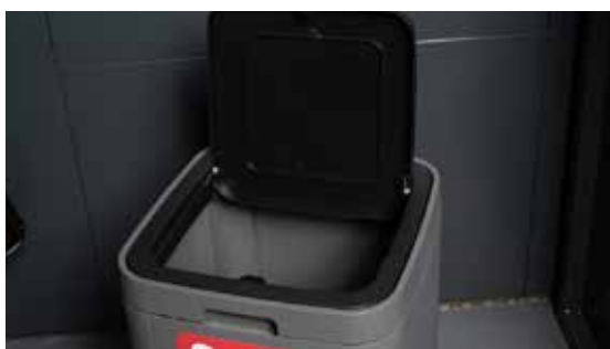
Kosz na śmieci mocowany do panelu ściennego