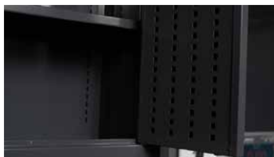
Ścianki oraz drzwi szafek narzędziowych z perforacją na narzędzia (maksymalne wykorzystanie przestrzeni wewnętrznej)