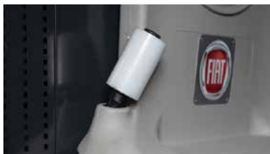
Panel z foliami zabezpieczającymi (pokrowce na siedzenia, dywaniki, osłona kierownicy)